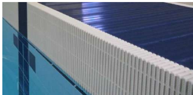
GRIGLIE E DOGHE GRIDS AND STAVES