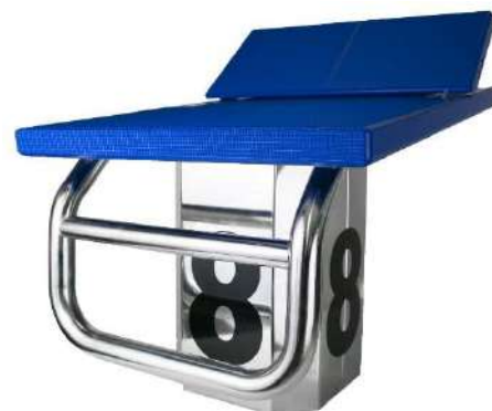
BLOCCO PARTENZA FIAMME STARTING BLOCK FIAMME