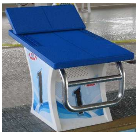
BLOCCO PARTENZA UDINE STARTING BLOCK UDINE