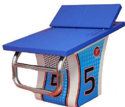
BLOCCO PARTENZA ZETA STARTING BLOCK ZETA