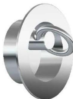
AGGANCIO CORSIA HOOKS FOR LANE