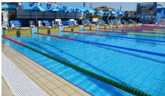
CORSIA FRANGIONDA BREAKWATER LANE