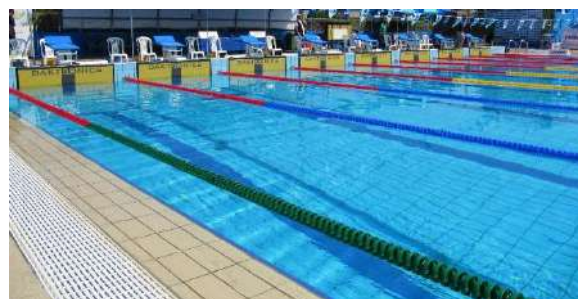
CORSIA FRANGIONDA BREAKWATER LANE