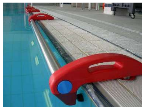
MANIGLIONE GINNICO HANDLE EXERCISER