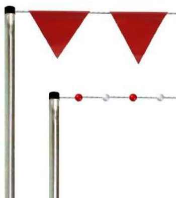
INDICATORI GARA COMPETITION SIGNS