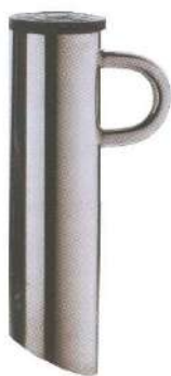
PALETTO ESTRAIBILE A BAIONETTA RETRACTABLE BAYONETTE PEG