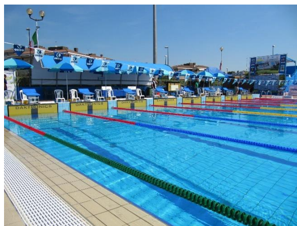
CORSIA FRANGIONDA BREAKWATER LANE