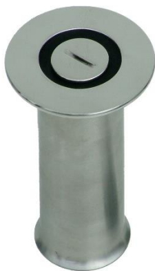
BASE DI FISSAGGIO POLIVALENTE MULTI-PURPOSE FIXING BASE