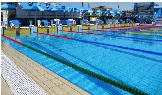
CORSIA FRANGIONDA BREAKWATER LANE