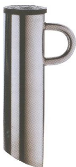
PALETTO ESTRAIBILE A BAIONETTA RETRACTABLE BAYONETTE PEG