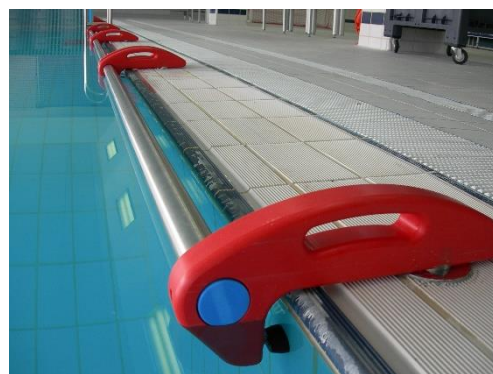
MANIGLIONE GINNICO HANDLE EXERCISER