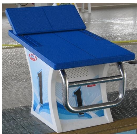
BLOCCO PARTENZA UDINE STARTING BLOCK UDINE Article n° 00150