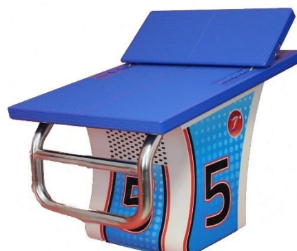
BLOCCO PARTENZA ZETA STARTING BLOCK ZETA Article n° 00140